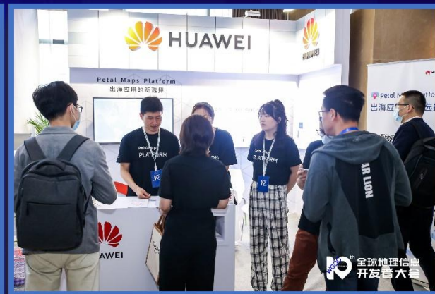
特装展示位示意图